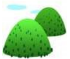
妙見山 (みょうけんさん)